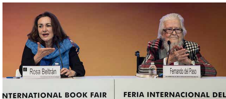
Rosa Beltrán y Fernando del Paso.

Rosa Beltrán, con los ojos en lágrimas, agradeció tan importante evento en el que tuvo la suerte de participar: estar al lado de Fernando del Paso, frente a Elena Poniatowska, para rendir tributo a Juan Rulfo, en la misma mesa que Gonzalo Celorio y Élmer Mendoza, sin duda era motivo de celebración para ella. Todos participaron en la mesa “De todos modos Juan te llamas”, con la que la FIL Guadalajara se sumó a las celebraciones por el centenario del nacimiento de uno de los autores más importantes de la literatura mexicana y del mundo. Con voz quebrada, Beltrán se permitió leer un pequeño discurso, y preguntó a la audiencia: “¿Cómo es que hemos leído tanto sobre un autor que no escribió siquiera 300 páginas de novela en total?”. Rememoró una célebre entrevista que hizo Poniatowska a Rulfo, a propósito de la función de las mujeres en su narrativa, y le preguntó si consideraba que estaban locas. “No, las