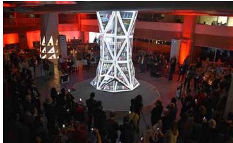
Presentación de la Librería Carlos Fuentes.

Como parte de la vocación y el compromiso de la Universidad de Guadalajara con la difusión de la cultura y el conocimiento, y en el marco de las actividades de la Feria Internacional del Libro de Guadalajara (FIL), fue presentada, el domingo 26 de noviembre a las 19:00 horas, por autoridades de la Universidad, la Librería Carlos Fuentes, que abrirá sus puertas al público en enero de 2018 con una amplia oferta editorial.