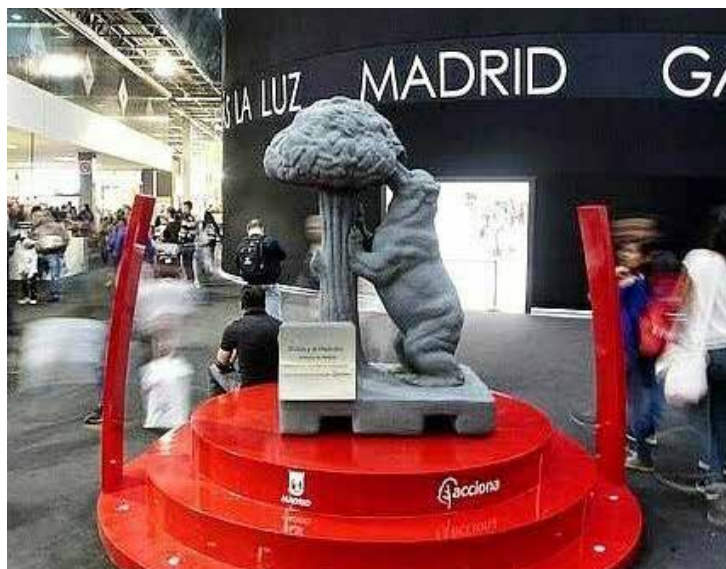
El Oso y el Madroño.