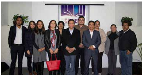
Participantes del “Curso CFDI 3.3 y su complemento de pago de nómina”.

Los temas abordados en el curso fueron: Análisis del anexo 20 “Facturación Electrónica versión 3.3”; Implementando el CFDI 3.3; Complemento de Recepción de pago; y Complemento 1.2 de nómina.